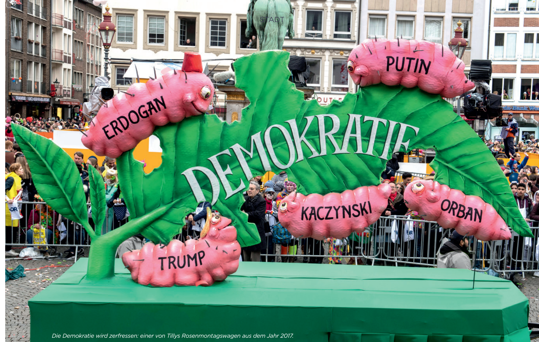
Die Demokratie wird zerfressen: einer von Tillys Rosenmontagswagen aus dem Jahr 2017.

Bis zu zwölf politische Wagen sind es an jedem Rosenmontagszug. Sie entstehen innerhalb von sechs Wochen und kurz vor der Hochphase des Karnevals in einer großen Wagenbauhalle in Bilk. Die Wagen werden in Leichtbauweise gefertigt, mithilfe eines dünnen Dachlattengerüsts, nassen Blumenpapiers, gekochten Leims und vieler Liebe zum Detail. Dabei unterstützt Tilly ein zehnköpfiges Team aus Bildhauern, Illustratoren und Malern. Direkt nach ihrem Auftritt am Rosenmontag werden die Kunstwerke wieder zerstört. „Sie sind nur für die jeweilige Saison gedacht“, so Tillys nüchterner Kommentar. Zu den politischen Wagen kommen jährlich elf Werbewagen für Brauereien, Autohersteller und andere Unternehmen und 15 Wagen für die Karnevalsvereine, inklusive des Prinzenpaarwagens. Außerdem Bühnendekorationen für den Prinzenball und weitere Sitzungen sowie unzählige Illustrationen. Neben dem Karneval fertigen Tilly und sein Team aber auch Plastiken für Messeauftritte, Diskotheken, Fernsehshows und andere Auf-