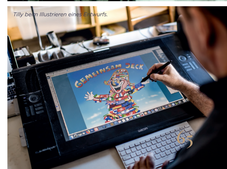
Tilly beim Illustrieren eines Entwurfs.