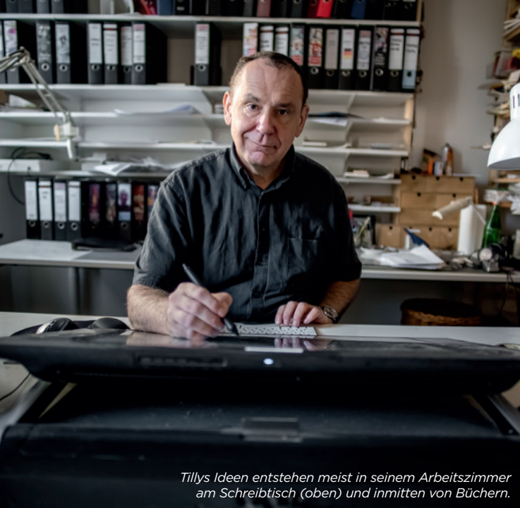
Tillys Ideen entstehen meist in seinem Arbeitszimmer am Schreibtisch (oben) und inmitten von Büchern.